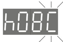
מצב Comfort כל בוקר בין 8:00 ל-8:59

דוגמאות להגדרות של מצבי פעולה בטיימר יומי (הגדרה 5)