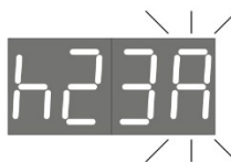
מצב Antifreeze ( +5^{\circ}\text{C} ) כל ערב בין 23:00 ל-23:59